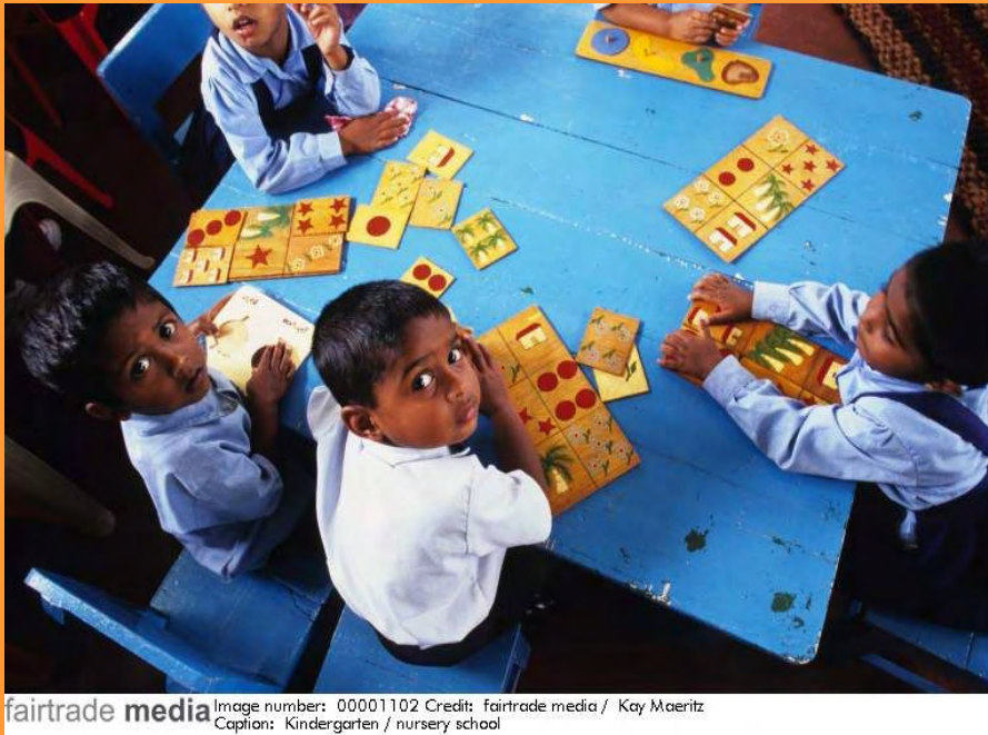
fairtrade media Image number: 00001102 Credit: fairtrade media / Kay Maeritz Caption: Kindergarten / nursery school